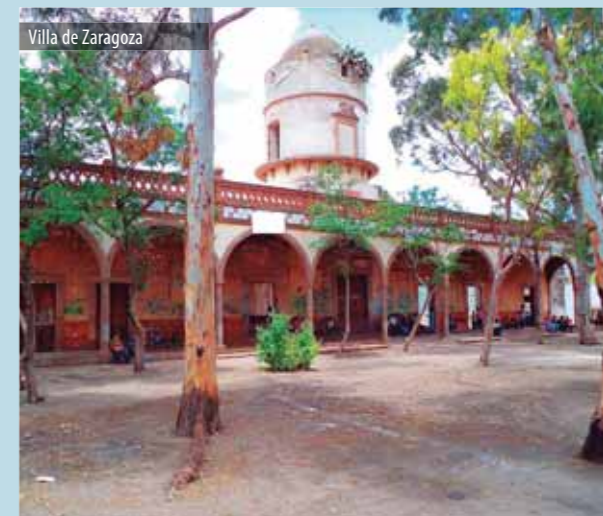
Villa de Zaragoza