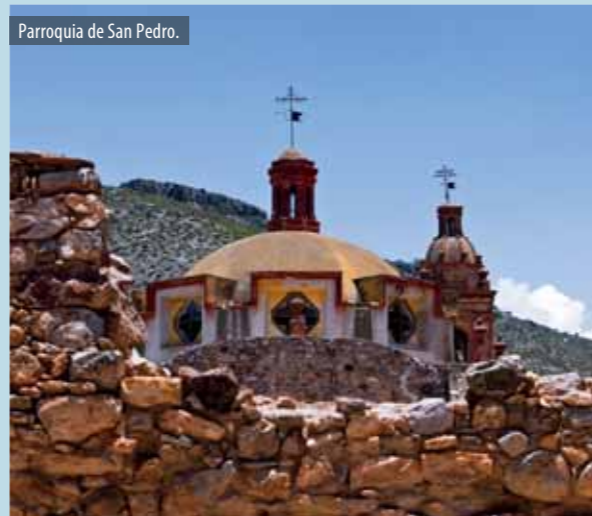
Parroquia de San Pedro.