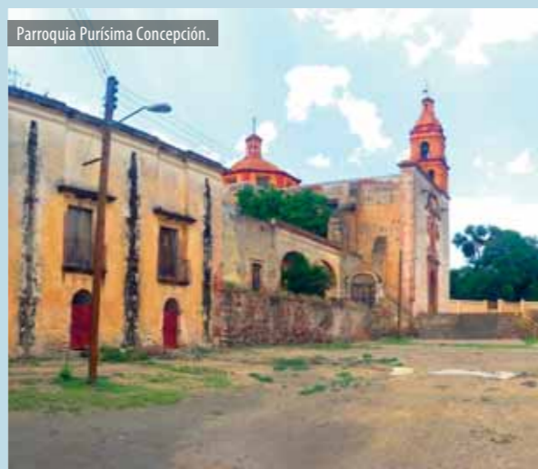
Parroquia Purísima Concepción.