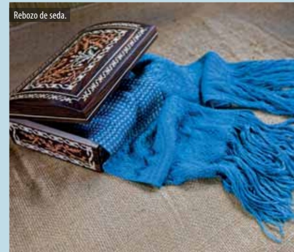
Rebozo de seda.