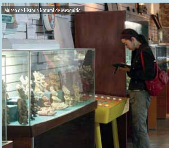
Museo de Historia Natural de Mexquitic.

De histórica vocación minera, en el pueblo todavía se aprecia el casco de la antigua hacienda de San Antonio de la Saucedá (fundada en el siglo XVI). La parte ecoturística de la Sierra de Álvarez destaca El Cárcamo de San Francisco, un río subterráneo de gran profundidad, y el Valle de los Fantasmas, paisaje boscoso caracterizado por sus formaciones pétreas. Entregados a las actividades agropecuarias, mineras y artesanales, cada 13 de junio sus habitantes se dan tiempo para festejar a San Antonio en su ya tradicional FERREZA (Feria Regional de Zaragoza).