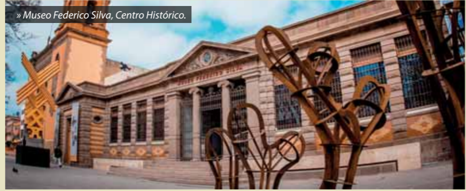
» Museo Federico Silva, Centro Histórico.