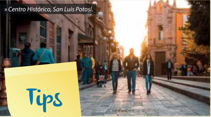
» Centro Histórico, San Luis Potosí.