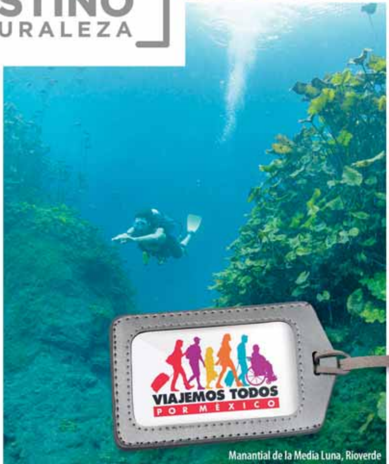
Manantial de la Media Luna, Rioverde