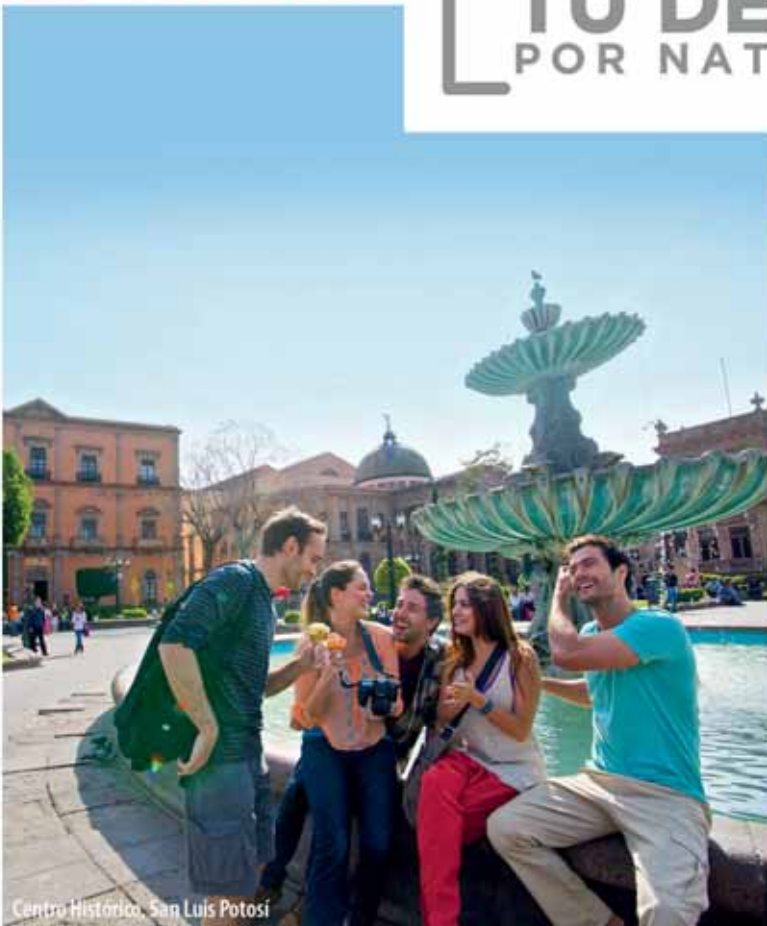
Centro Histórico, San Luis Potosí