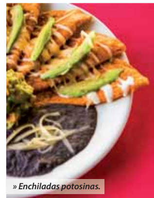
» Enchiladas potosinas.