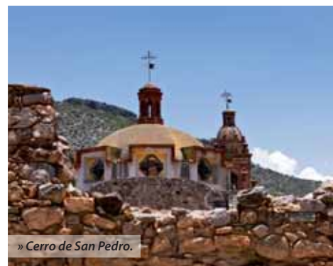
» Cerro de San Pedro.