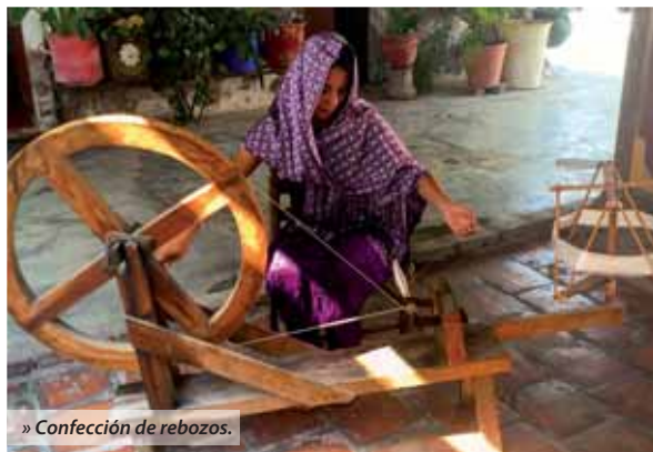
» Confeción de rebozos.

A 40 minutos de la capital se encuentra Armadillo de los Infante , un encantador municipio, con sus calles angostas y empedradas. Puedes caminar hasta lo alto del pueblo donde es posible observar sus dos templos de altas cúpulas, el de la Purísima Concepción y el de Guadalupe , para después bajar por un paraíso de arquitectura colorida. Podrás disfrutar de una variedad de restaurantes con platillos típicos y de sabor exquisito que sólo en este destino podrás encontrar.