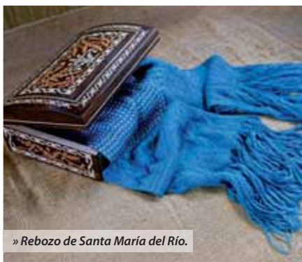
» Rebozo de Santa María del Río.