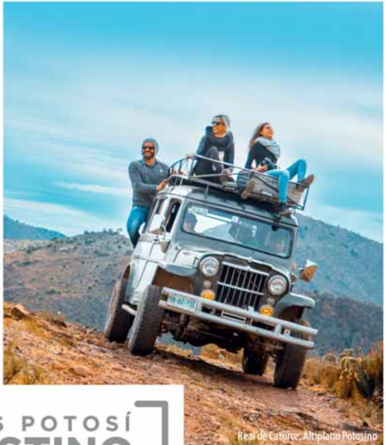
Real de Catorce, Altiplano Potosino