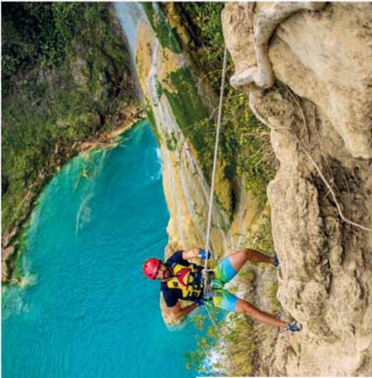
Cascadas de Minas Viejas, Huasteca Potosina